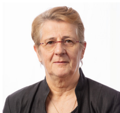
Hervé Lefebvre Maire de Samatan